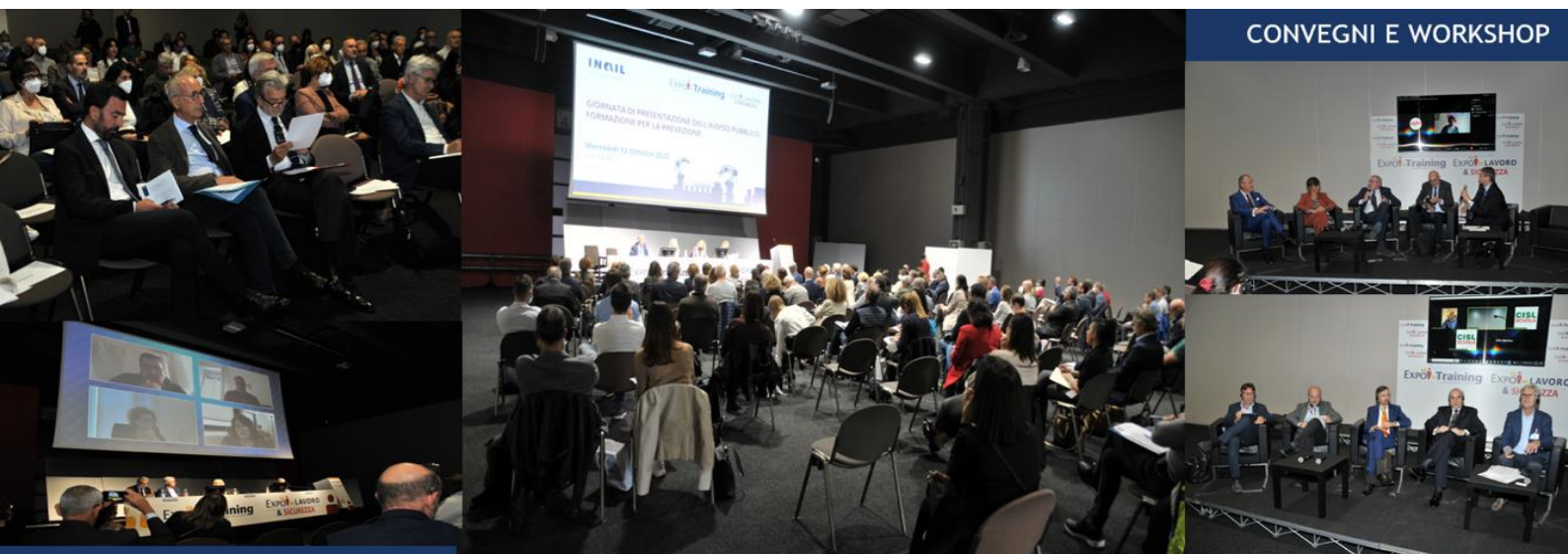
CONVEGNI E WORKSHOP